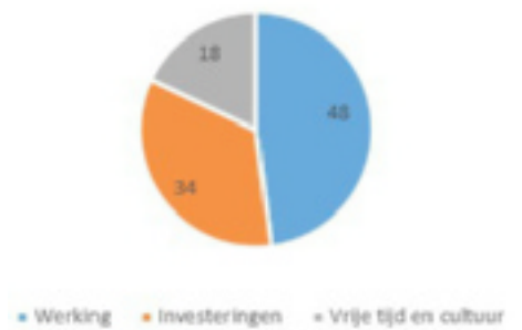
Subsidies aan de voorzieningen 412.953 €

Zonder uw steun, uw giften en legaten was niets van dit alles mogelijk geweest. In naam van de voorzieningen en hun personeel maar vooral in naam van de jongeren die er opgevangen worden, danken we U voor uw vrijgevigheid.